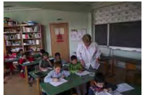
Roma-Kinder beim HDZ-Besuch im Lager Carei