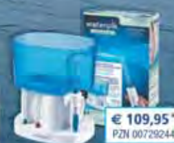
Dental-Center Complete Care WP-900E