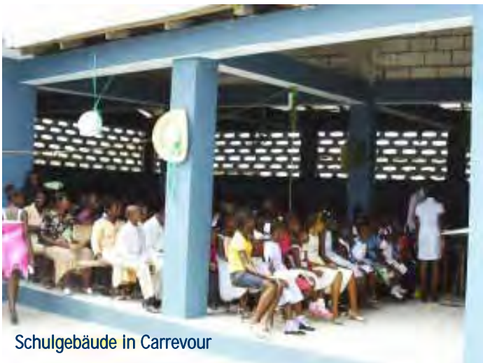
Schulgebäude in Carrefour

Hier zeigte sich eine fruchtbare und unkomplizierte Zusammenarbeit beider Hilfsorganisationen. Das HDZ finanzierte zunächst die Anschaffung von Schulcomputern und die Ausstattung der Schulküche und danach die Einrichtung eines zusätzlichen Schulgebäudes, das im Juni 2013 eingeweiht werden konnte. Es ist nun sogar