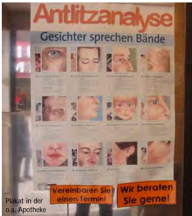
Plakat in der o.a. Apotheke

Salze gezählt) und Anthroposophie, die nach dem „Binnenkonsens“ keine Wirksamkeit belegen müssen. Das ist doch ein richtiges Glück für die Hersteller von magischen Heilmitteln, nicht?