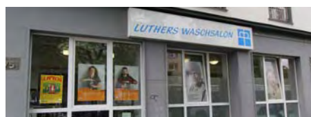
In Luthers Waschsalon wird übrigens auch Wäsche gewaschen.

Herzliche Glückwünsche an den Preisträger!