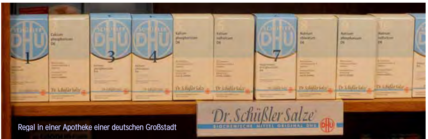
Regal in einer Apotheke einer deutschen Großstadt

Falls Sie sich nicht entscheiden können, an welcher Krankheit Sie oder Ihre Patienten leiden, können Sie die so genannte „Antlitzdiagnostik“ anwenden. Diese wurde ebenfalls von W.H. Schüßler entwickelt.