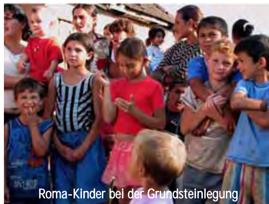
Roma-Kinder bei der Grundsteinlegung